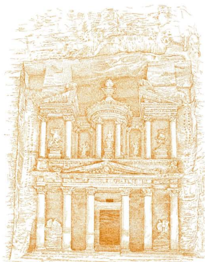
Illustr. : Le Trésor du Pharaon, Perchat del. d'ap. photo Barthe Claude/SUNSET