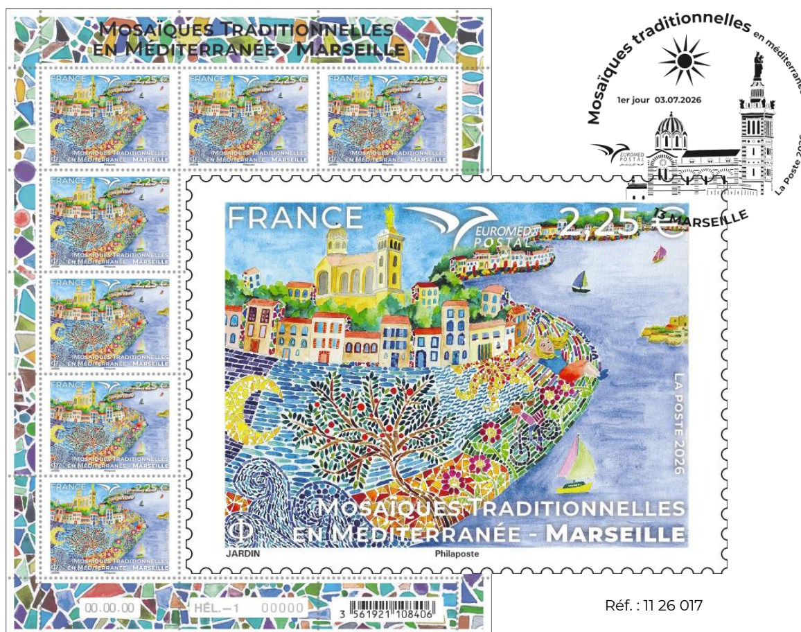
Visuels d'après maquettes - Couleurs non contractuelles/disponibles sur demande

Le 6 juillet 2026, La Poste émet un timbre sur les mosaïques traditionnelles en Méditerranée à Marseille dans le cadre du concours EUROMed 2026.