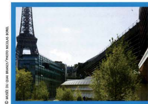
↑ Vue du musée du Quai Branly, côté rue de l'Université.

T&V : En quoi la visite de ce musée propose une expérience différente des autres grands musées de la capitale ?