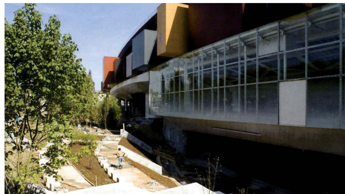
↑ Façade nord du musée du Quai Branly, côté quai Branly.

S.M. : Le projet de Jean Nouvel a la particularité de créer un jardin de 18 000m 2 grâce à un bâtiment sur pilotis. Quant au parti pris de la muséographie, elle permet l'accessibilité maximale aux collections et offre au public de multiples sources de découvertes et de connaissances sur les œuvres exposées.