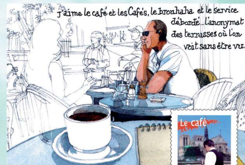
↑ Page illustrée du carnet de voyage.