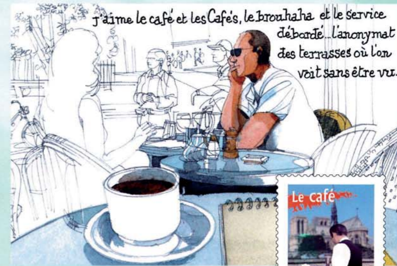
↑ Page illustrée du carnet de voyage.