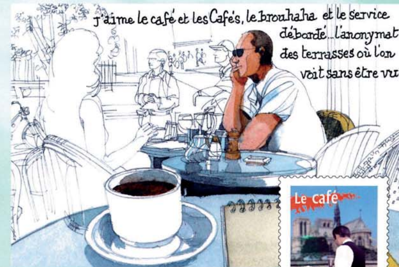
↑ Page illustrée du carnet de voyage.