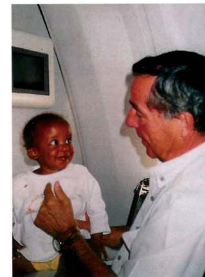
↑ Accompagnement d'enfant malade.

et des mécaniciens. Les grosses ONG qui font appel à nous participent simplement aux frais de transport. Nous venons aussi en aide aux petites associations, avec peu de moyens, en utilisant les lignes régulières d'Air France pour faire de la messagerie médicale. Par exemple, une petite association franco-camerounaise a fait parvenir des médicaments et un fauteuil roulant au Cameroun pour cinq euros le colis. C'était notre cent millième colis depuis que l'association existe !