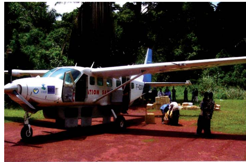
← Mission en Afrique.

J-C. G. : Nos avions sont pilotés et entretenus par des bénévoles d'ASF, ils ne coûtent donc rien aux associations que nous épaulons. En ce moment, ils se relaient tous les mois au Congo. Ce sont des pilotes en recherche d'emploi, qui ont pour objectif de faire des heures de vol, ou encore des retraités, ex-pilotes de ligne, d'aéroclub ou de l'armée,