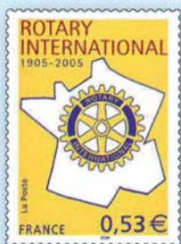
↑ Conçu par Atelier Didier Thimonier