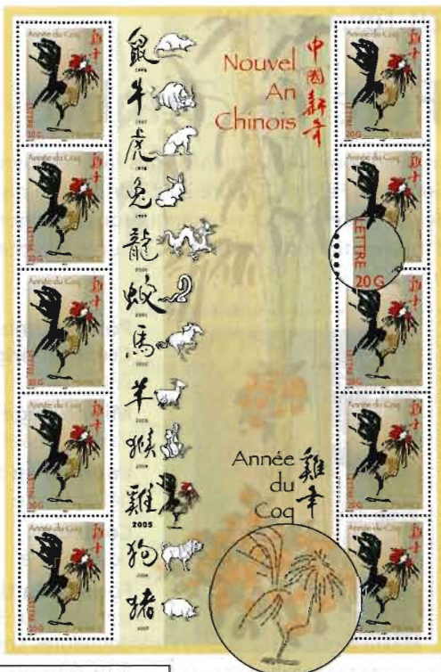
un dessin qui révèle des surprises à observer à la loupe

bloc de 10 timbres avec mention "lettre 20 g" remplaçant la valeur faciale "0,50 €"