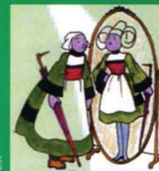
vu par Paco Rabanne