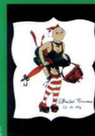
vu par Chantal Thomass