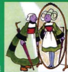
vu par Paco Rabanne