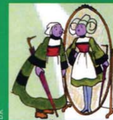
vu par Paco Rabanne