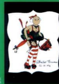
vu par Chantal Thomass