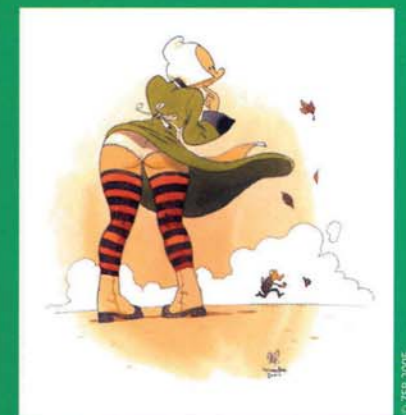
vu par Zep