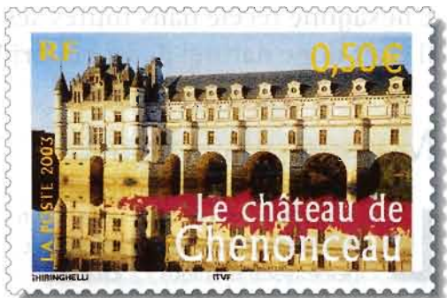
Photo : Sunset – Marge Graveur du poinçon du timbre pour le document philatélique : Yves Beaujard Imprimé en : héliogravure Couleurs : polychrome Format : horizontal 35 x 22 Valeur faciale : 0,50 €