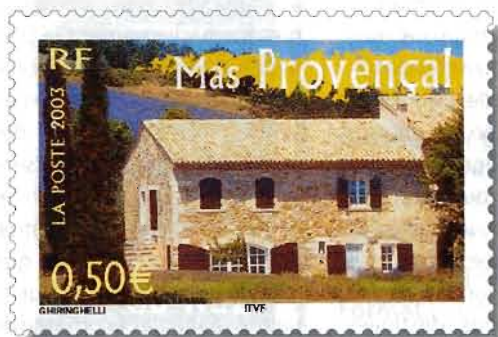
Photo : Images – F. Rozet / maison d'hôtes, Banon (04) Graveur du poinçon du timbre pour le document philatélique : Pierre Forget Imprimé en : héliogravure Couleurs : polychrome Format : horizontal 35 x 22 Valeur faciale : 0,50 €