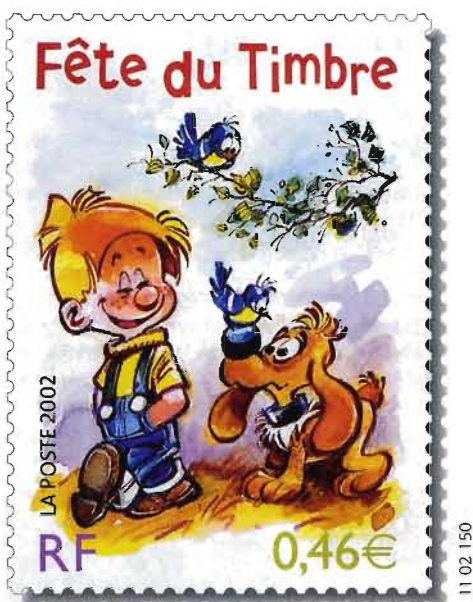
© Boule Et Bill ® International s.a. 2002. (Photo d'après maquette et couleurs non contractuelles).