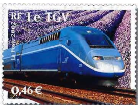
Le train : SNCF-CAV / J.J. D'Angelo. Fond : SNCF-CAV / M. Urtado.