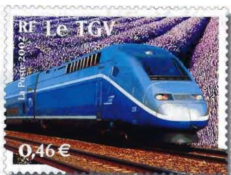
Le train : SNCF-CAV / J.J. D'Angelo. Fond : SNCF-CAV / M. Urtado.