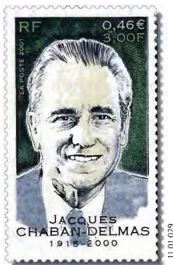
Photo d'après maquette et couleurs non contractuelles