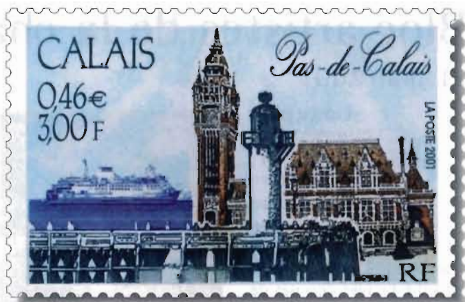
D'après photos V. Gauvreau (Hôtel de ville et ferry). Photo d'après maquette et couleurs non contractuelles.