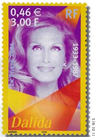
d'après photo © Fonds Orlando Productions