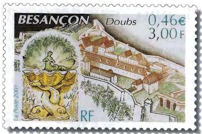
Photo d'après maquette non contractuelle.