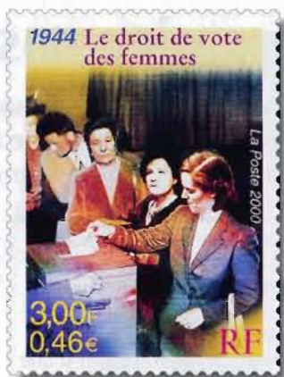
Timbre : © photo Keystone, Paris Fond du bloc : © Collection Violet