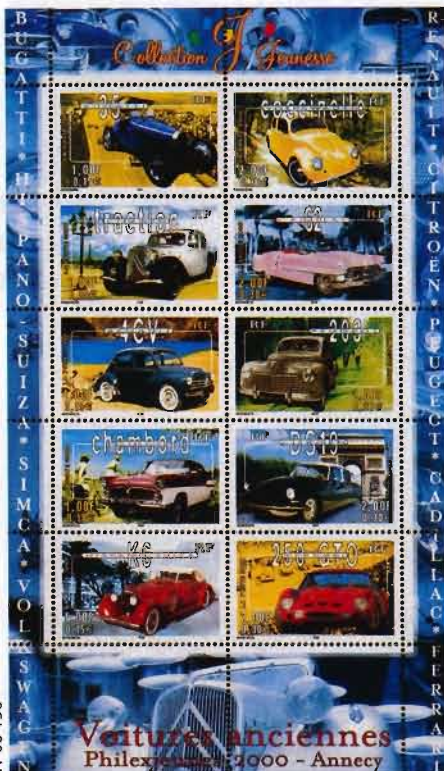
Bugatti 35 : voiture ; d'après photo musée national de l'Automobile - collection Schlumpf. Fond de maquette droits réservés. Cadillac 62 : voiture ; d'après photo V. Gauvreau/musée de l'automobile de la Défense. Fond de maquette d'après photo rue des Archives/TAL. Cocinelle Volkswagen : voiture ; droits réservés. Fond de maquette ; droits réservés. Citroën Tracton : d'après photo V. Gauvreau/musée de l'automobile de La Défense. Fond de maquette ; d'après photo Roger Viollet. Renault 4 CV : voiture ; droits réservés. Fond de maquette ; d'après photo AFP. Simca Chambord : voiture ; droits réservés. Fond de maquette ; droits réservés. Citroën DS 19 : voiture ; d'après photo AFP. Citroën DS 19 : voiture ; d'après photo V. Gauvreau : musée de l'automobile de La Défense. Fond de maquette ; droits réservés. Hispano-Suiza K6 : voiture ; droits réservés. Fond de maquette ; d'après photo Roger Viollet. Ferrari 250 GTO : voiture ; droits réservés.