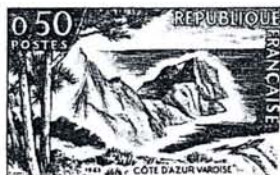
La Pointe des Trayas

Parmi les villes situées au cœur de l'Auvergne, il n'en est sans doute pas de plus pittoresque que Saint-Flour qui, fondée peut-être par Saint Flour lui-même au IV e siècle de l'ère chrétienne, se développa surtout au Moyen Âge : n'était-elle pas campée sur un éperon basaltique qui en faisait une « ville rochère et de défense » ? Siège d'une abbaye fondée par Odilon de Cluny au XI e siècle, elle fut érigée en évêché par Jean XXII au début du XIV e siècle. De là des édifices religieux remarquables, des hôtels particuliers bien conservés, de nombreuses maisons anciennes. La ville a essaimé au pied du piton, dans la vallée du Lander. Si Aurillac l'a peu à peu emporté par sa vie économique et son rôle de préfecture, Saint-Flour a gardé des éléments importants d'activité judiciaire et une tradition bien vivante de petite capitale régionale.