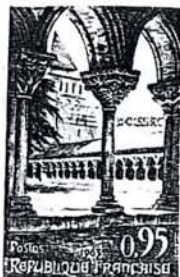
Cloître et église abbatiale Saint-Pierre

Pendant longtemps Vittel a connu surtout une activité industrielle, textile essentiellement, grâce à la proximité des filatures vosgiennes. Mais depuis le milieu du XIX e siècle, c'est principalement l'exploitation de ses eaux minérales, déjà connues des Romains, qui a assuré l'essor de la petite ville. Ces eaux, sulfatées, calciques ou bicarbonatées, ferrugineuses, sont employées contre les affections des voies urinaires, l'arthritisme, et les manifestations hépatiques. Depuis quelques années Vittel a mis au point une formule de « cure de détente » qui lui assure une clientèle de plus en plus assidue parmi les citadins soumis au rythme trop trépidant de la vie contemporaine. La station aspire à être un îlot de calme et de repos et tout est organisé pour atteindre ce but.