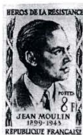
8 F Jean MOULIN