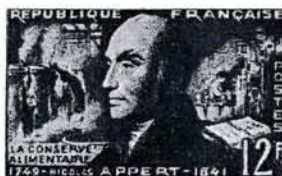
12 F. N. APPERT VERT FONCÉ ET VERT Dessiné et gravé par Cheffer Vente anticipée à Châlons-sur-Marne (Recette principale)

Artisan et mécanicien, Thimonnier dut lutter toute sa vie — et avec un succès médiocre — pour tenter d'imposer son invention de la première machine à coudre, réalisée en 1830. Elle ne fut définitivement adoptée qu'en 1851 et le mérite de Thimonnier reste encore peu connu.