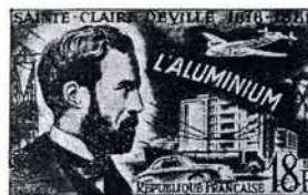
18 F. SAINTE-CLAIRE DEVILLE BLEU ET GRIS BLEUTÉ Dessiné et gravé par Decaris Vente anticipée à Paris (Recette principale)

C'est en 1831 qu'Appert a publié son ouvrage « L'art de conserver toutes les substances animales et végétales » où il expliquait et justifiait les détails de son procédé. Il est ainsi l'initiateur de la science des conserves, dont le développement a eu d'importantes conséquences géographiques, économiques, sociales.