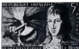
5 F. LE BON BLEU ET BLEU CLAIR Dessiné et gravé par Hertenberger Vente anticipée à Brachay (Haute-Marne)

L'accélération de l'histoire, dont tous nos contemporains ont désormais conscience, est due surtout aux révolutions économiques et aux inventions techniques du XIX e siècle. Ainsi les six inventeurs et savants français - évoqués par cette série de timbres-poste - ont-ils été - à des titres divers - à l'origine du monde moderne.