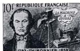
10 F. THIMONNIER BRUN FONCÉ ET BISTRE Dessiné et gravé par Cottet Vente anticipée à L'Arbresle (Rhône)

Ingénieur des Ponts et Chaussées, puis professeur à Paris, Le Bon commença vers 1797 ses essais sur l'emploi pratique du gaz, en particulier pour son application à l'éclairage. Une mort prématurée l'empêcha de mettre au point de fructueuses recherches sur les machines à gaz et à vapeur.