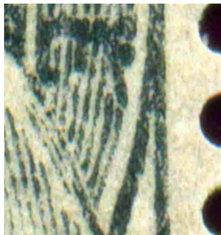
Type II : pli de la robe 2 traits