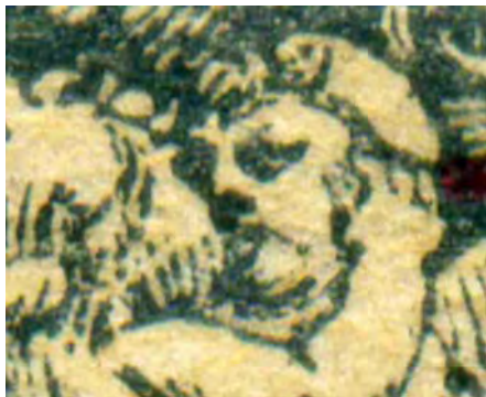
Type I : cicatrice sur la joue gauche de l'angelot