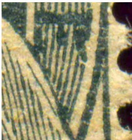
Type I : 1 trait dans le pli de la robe