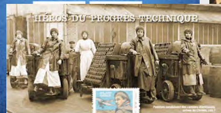
SI LA PREMIÈRE GUERRE MONDIALE BRÛLE L'ESPOIR PROGRÈS ET LE DÉVELOPPEMENT DES TECHNIQUES, LA GUERRE L'EST AUSSI GAGNÉE SUR LE FRONT DES VIEUX.