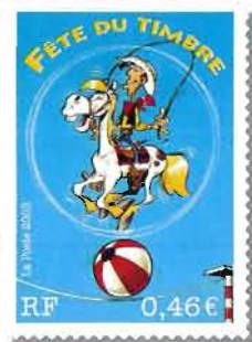
© Lucky Comics 2003. (Photo d'après maquette et couleurs non contractuelles).