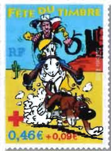
© Lucky Comics 2003. (Photo d'après maquette et couleurs non contractuelles).