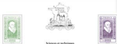
Sciences et techniques