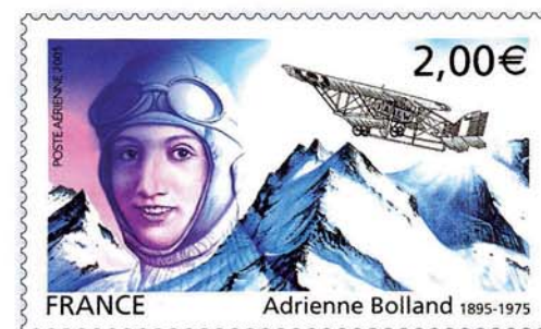
... au timbre définitif émis par La Poste. ↑