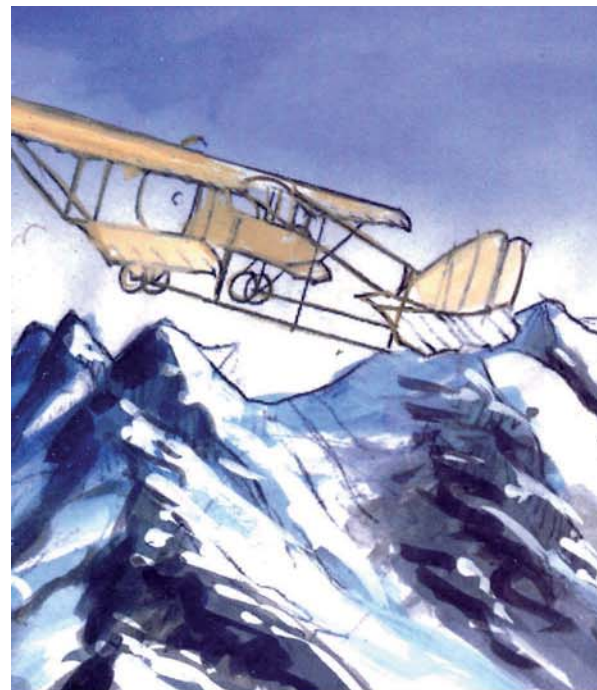
↑ De la peinture originale de Christophe Drochon...