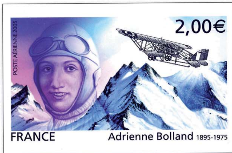
↑ La maquette finalisée du timbre.

Christophe Drochon , peintre animalier et également le dessinateur de plusieurs timbres de la série "Poste aérienne". Nous vous faisons découvrir ses travaux préparatoires (esquisses, crayonnées) qu'il a réalisés pour le timbre "Adrienne Bolland" émis en octobre dernier.