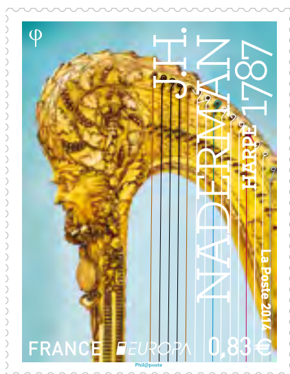
Timbre français participant au concours PostEurop

Le concours EUROPA sera ouvert au public du 9 mai 2014 (Journée de l'Europe) au 31 août 2014. À partir du 9 mai 2014, tous les internautes pourront découvrir et voter en ligne pour leur timbre préféré sur le site Internet de PostEurop ( www.posteurop.org/europa2014 ).