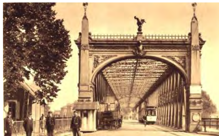
De 1897 à 1918, le pont sur le Rhin et le tram strasbourgeois.