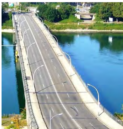
Le pont de l'Europe, de nos jours.

Pont de l'Europe : ce pont routier à quatre voies permet, de part et d'autre des voies routières, le passage des piétons et des cyclistes.