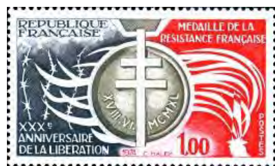
Libération et médaille de la Résistance française

De retour à Paris, Aubrac rencontre le ministre de la Reconstruction qui lui propose le poste de commissaire aux Travaux pour la Bretagne. Quelques semaines plus tard, il est nommé inspecteur général, responsable des opérations de déminage sur l'ensemble du pays, puis il intègre le ministère de la Reconstruction jusqu'en 1948.