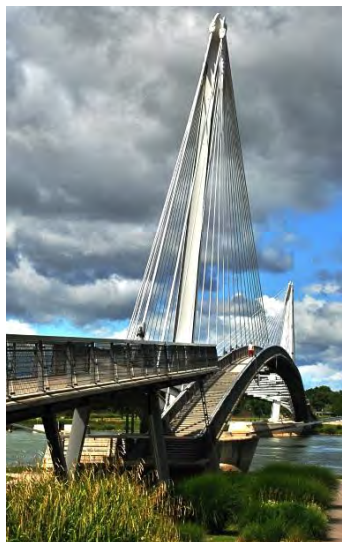
Passerelle du Jardin des deux Rives

Après ces six mois de festival, le Jardin des Deux Rives a trouvé sa place, à la fois celle d'un espace de rencontres et d' échanges entre Strasbourgeois et Kehlois mais c'est aussi un lieu festif et convivial au bord de l'eau. Il représente également un lieu d'accueil privilégié pour les manifestations liées aux arts du cirque . Cet espace de plus de 60 hectares comprenant entre autres 650 nouveaux arbres , et près de 8000 arbustes est ouvert à tous et est un symbole fort de la construction européenne