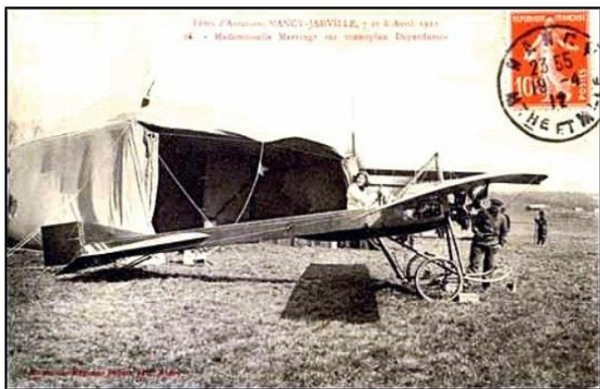
Terrain d'aviation de Nancy - Jarville en 1912

Né le 28 février 1883 à Antibes (Alpes-Maritimes) et décédé le 27 janvier 1914 à l'Hôpital du Val-de-Grâce (Paris, Ve Arr.).